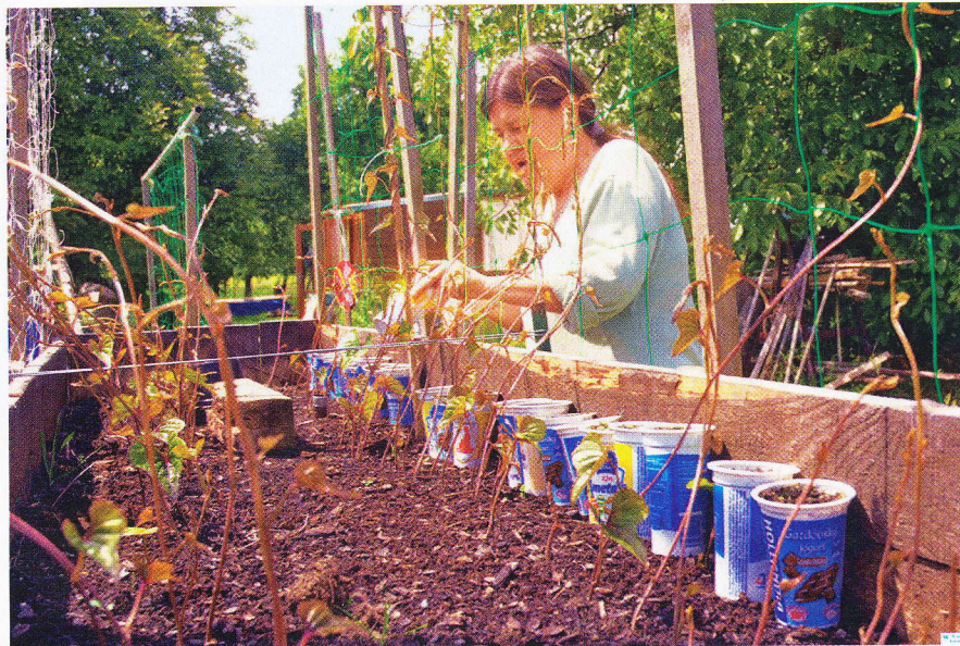
Červnové rašící výhonky světlého kořene. Skvělé podmínky ve „světelné bedně“ se dají využít pro předpěstování jiných sazenic.

da, jehož dílo De materia medica vyšlo z poznatků okruhu Platónovy akademie. Renesančnímu světu zprostředkoval antické dílo Pietro Andrea Mattioli ve svém slavném Herbáři , který z Dioscorida vychází. Jeho českým překladatelem byl Tadeáš Hájek z Hájku, dvorní arbiter elegantiarum na dvoře Rudolfa II., který stál u zkoušek všech alchymistů, ucházejících se o panovníkovu přízeň. V rozsáhlých císařových sbírkách určitě viděl i Voynichův rukopis , snad práci františkánského mnicha Rogera Bacona, který prý měl obsahy některých svých děl čerpat z „atlantských vzpomínek“. Zajímavým důkazem pro to má být latinská věta A mihi daba maltas portas, Dal jsi mi mnoho bran , a vyobrazení rostliny mimořádně podobné jamu čínskému.