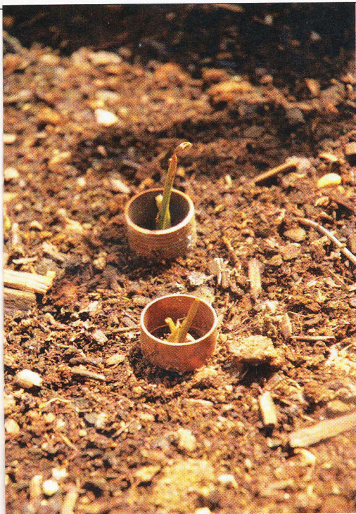
Ideální ochranu před slimáky poskytnou mladým sazenicím kořene měděné kroužky.